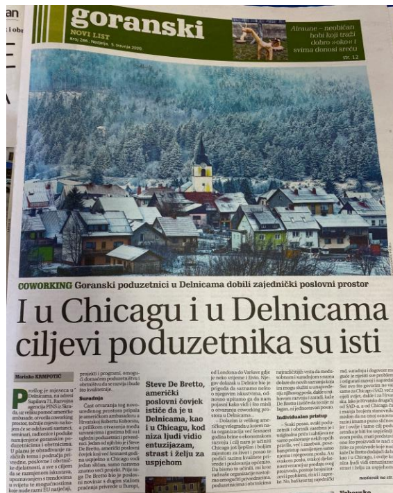
Slika 4: Isječak iz Goranskog Novog lista (travanj 2020)