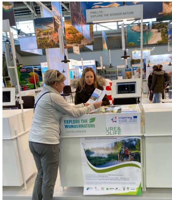
Slika 2: Sajam f.re.e – štand